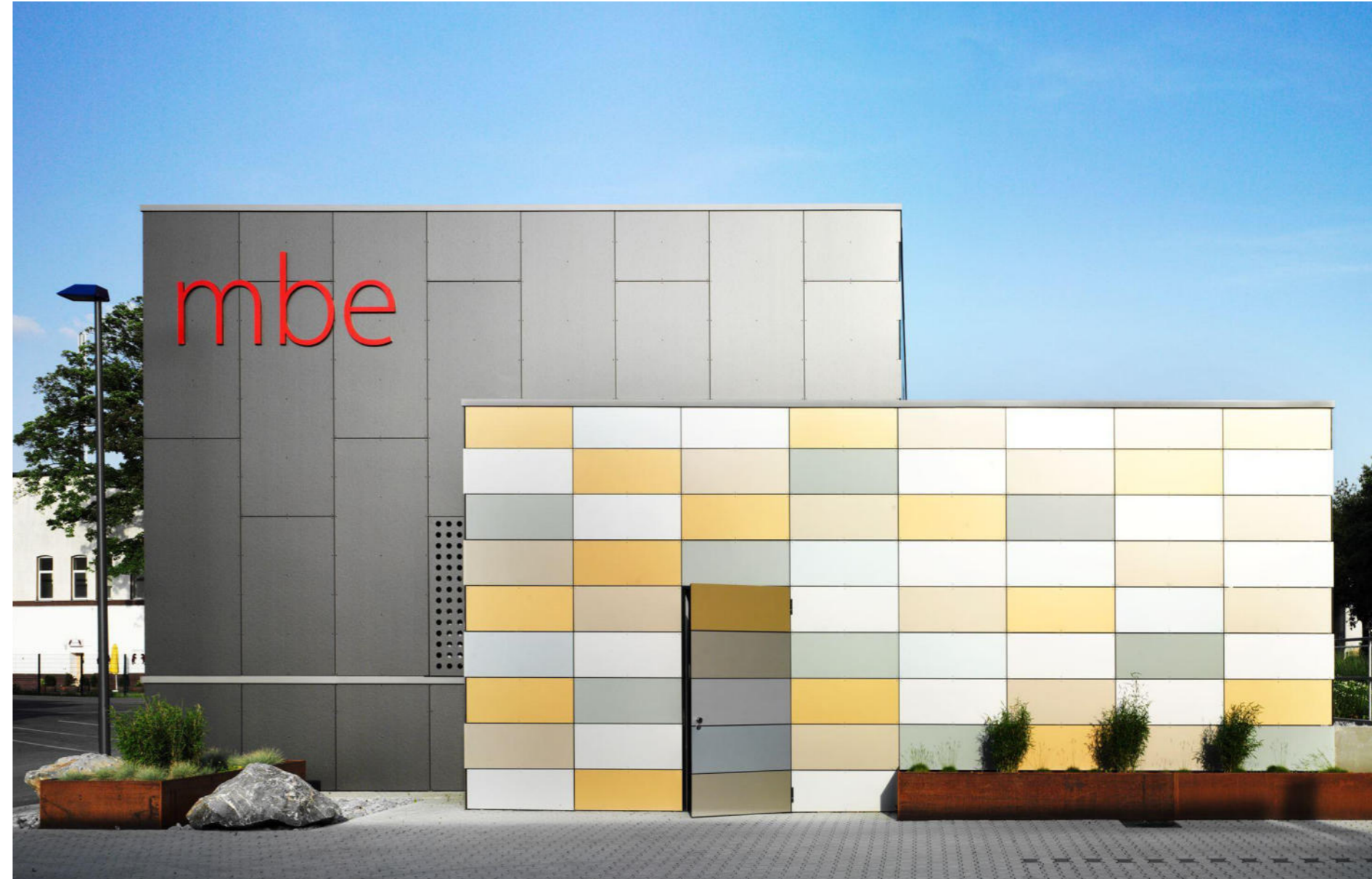
Verwaltungsgebäude Am Törnigskamp 8 58706 Menden